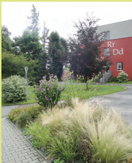
U základní školy