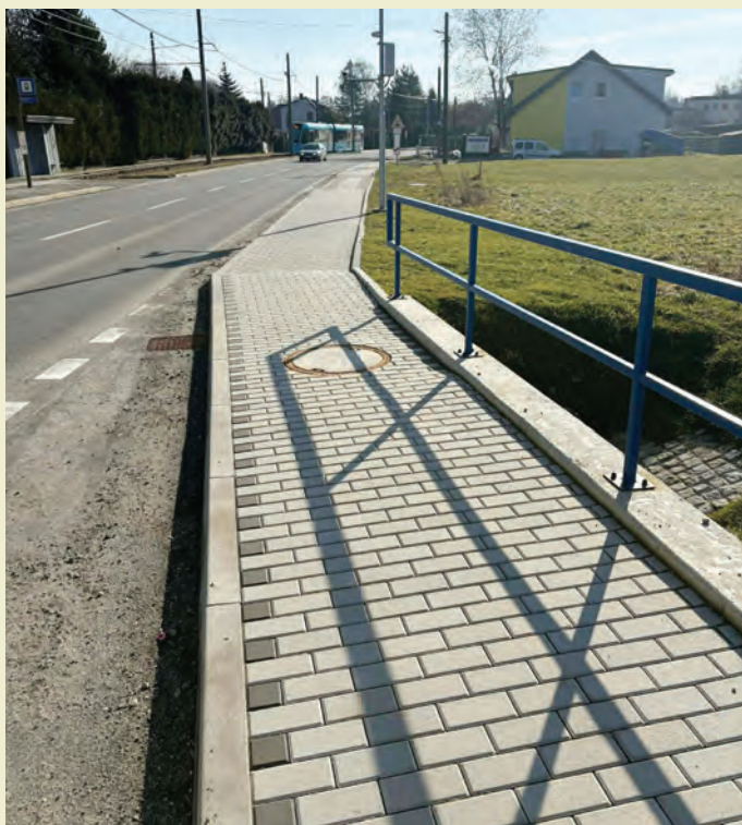
Chodník ke hřišti U Opusty

(listopad roku 2022), měla obec na účtech cca 28.000 000, -Kč , neměli jsme sjednaný žádný úvěr, nikomu jsme nic nedlužili, všechny významné investiční záležitosti byly ukončeny, faktury vystaveny a obci řádně a včas zaplacený.