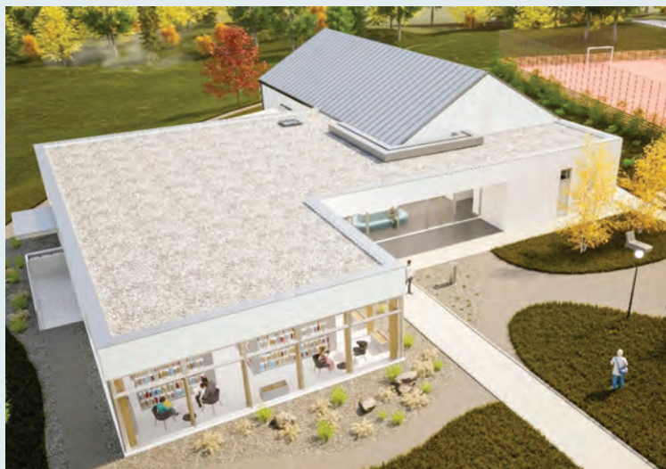
Společenský dům Vřesina. Zdroj Architektonická studie Ateliér Chválek s.r.o.

Každoročně jsou prováděny opravy živých povrchů obecních komunikací.