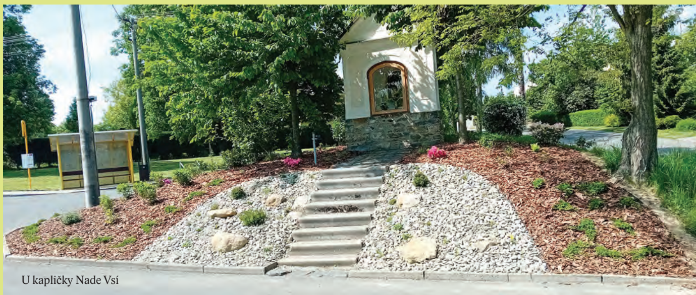
U kapličky Nade Vší