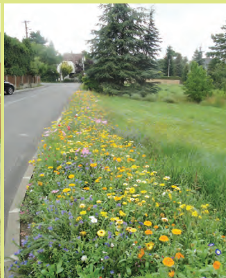
Záhon na Malé straně