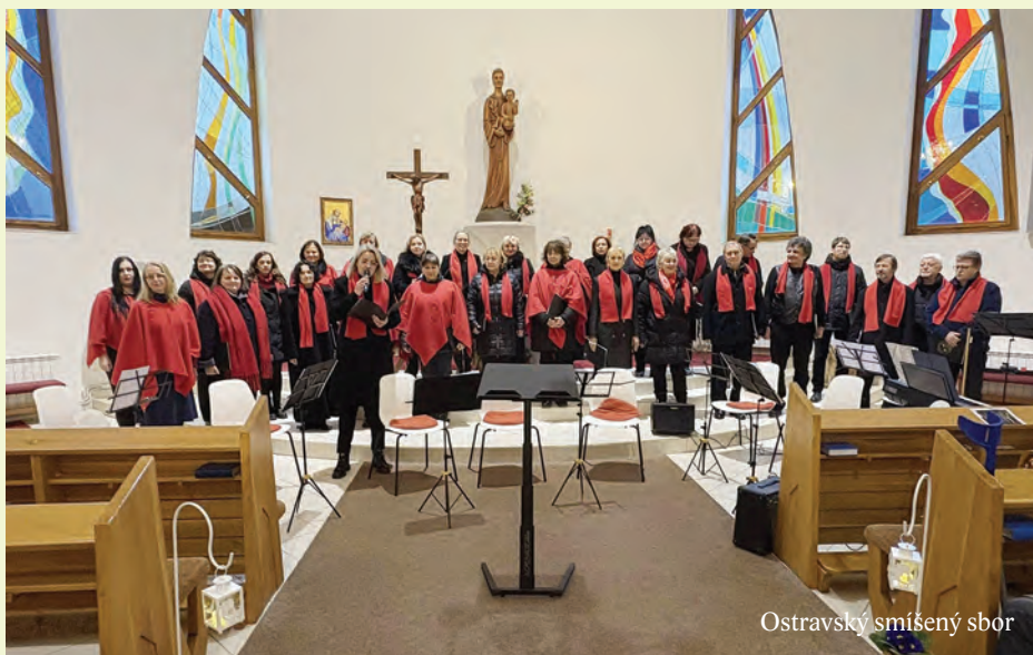
Ostravský smíšený sbor