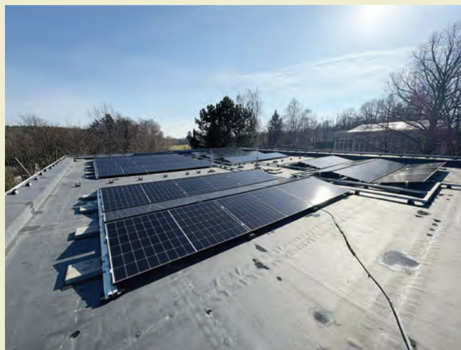
Fotovoltaika na budově MŠ Vřesina

Když současné vedení obce nastupovalo do svého úřadu