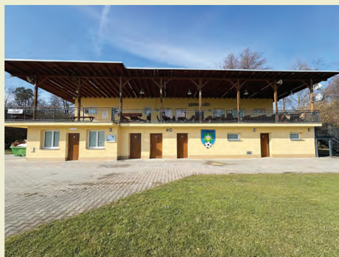
Rekonstrukce zázemí sportovního areálu U Opusty

Dům zahrádkářů (nová kuchyň, bar, sklepy, garáž apod.) 1 000.000, -Kč