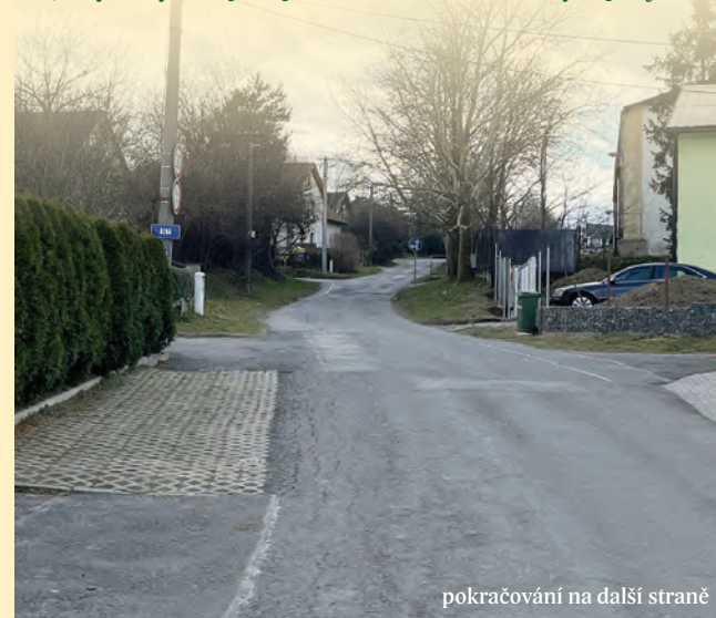
pokračování na další straně

- projekt bude realizován minimálně ve třech etapách tak, aby vždy alespoň polovina ulice Selská byla průjezdná